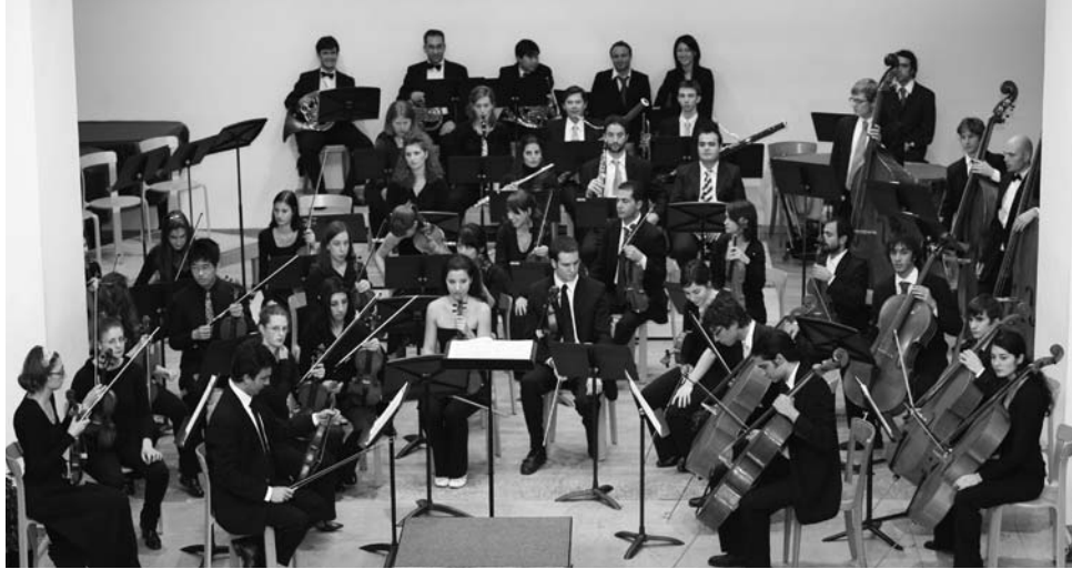
Orchestra da Camera di Lugano