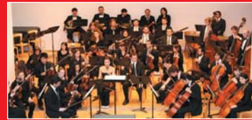
Orchestra da Camera di Lugano